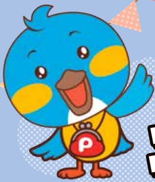
イメージキャラクターの カワセミピツピくん