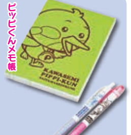
ピンクボールペンとシャープペン