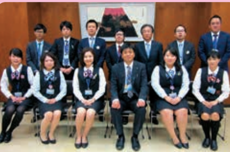
● 宮地委員長と編集委員メンバー

【埼玉信用組合 本部(営業統轄部) 0495-72-3511】 フリーダイヤル 0120-097-874