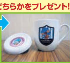
ピピくん「マグカップ」