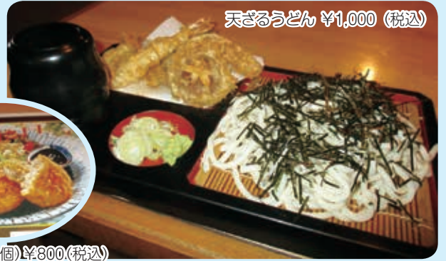
天ざるうどん ¥1,000 (税込)