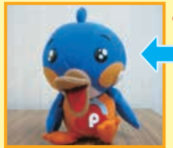
ピピくん「めいぐるみ」