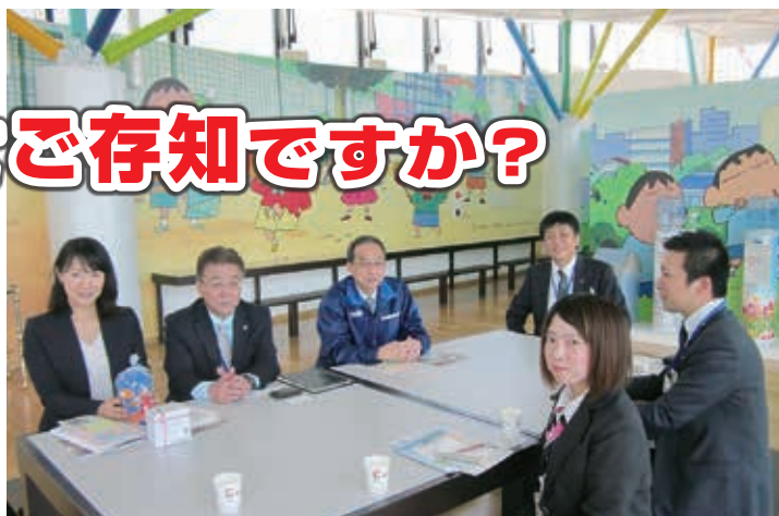
取材風景 (28.4.19) 左から森嶋広報室長代理、堀内本庄工場長、入交執行役員の皆さんと編集委員