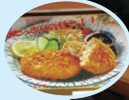
牛肉コロッケ(2個) ¥800(税込)

お腹一杯食べたい方は、定食をはじめご飯ものもありますので、お近くにお越しの際には是非お立ち寄りください。