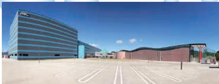
クリクラ本庄工場全景 本庄市児玉町児玉2256