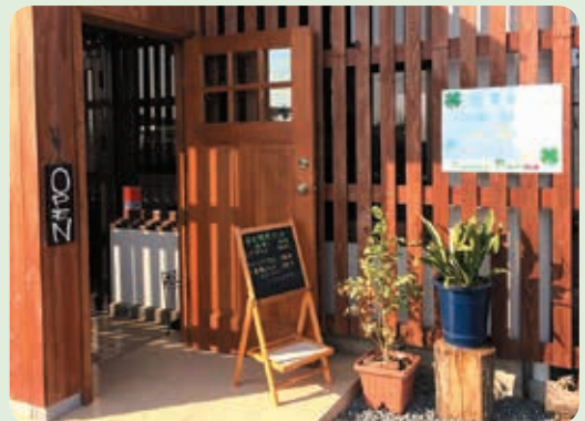
オムライスセット (サーモンとほうれん草のクリームオムライス) 各ドリンク・サラダ・ドルチェ付 (¥1,380)