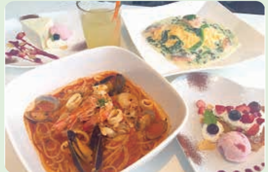
パスタセット (ペスカトーレ)